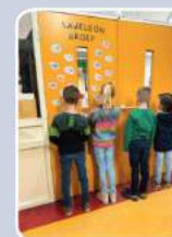
De Kameleon-groep is een fijne plek