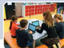
Dit zijn fijne manieren van leren