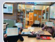
De wiabordjes werken heel fijn