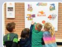
Wij gebruiken "De 7 Gewoonten" als onze regels