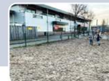
We willen graag een mooi schoolplein