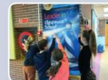
We zijn trots op onze 'Lighthouse'-school